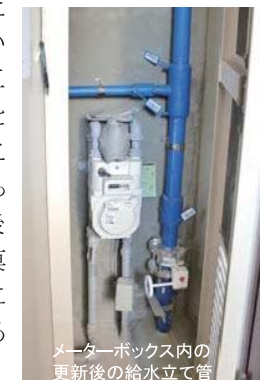
メーターボックス内の更新後の給水立て管

また、大掛かりな工事を予想していましたが、台所の配管は原設計において更新を想定した設計になっていたとのことで、工事大掛かりになっていないことに感心させられました。今後の設備大規模工事の計画に大変参考になると思います。