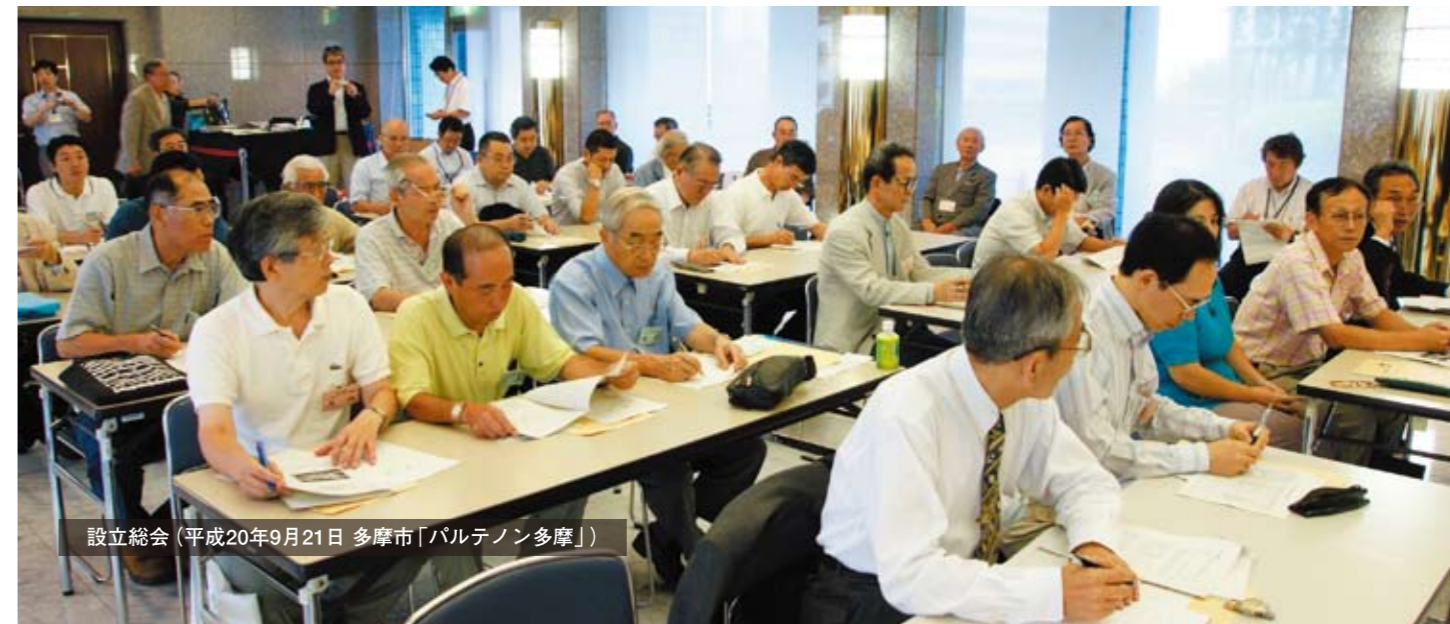
設立総会(平成20年9月21日 多摩市「バルテノン多摩」)