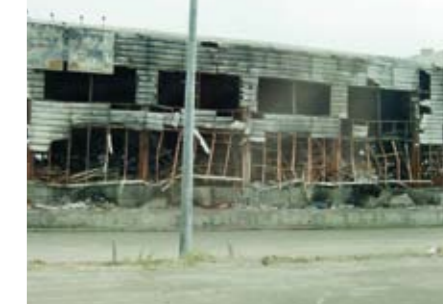
東北の被災地